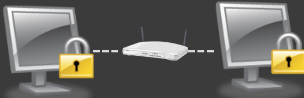
Fernsteuerung eines PraxisPC über VPN

Es ist nur eine Verbindung zum ferngesteuerten PC möglich